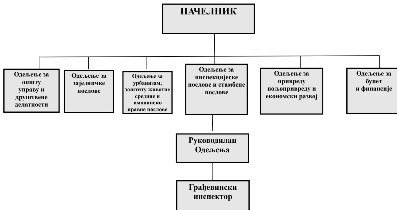
Табела 1. Организациона структура у области грађевинске инспекције