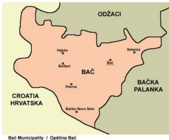
Слика 1. Мапа Општине 8