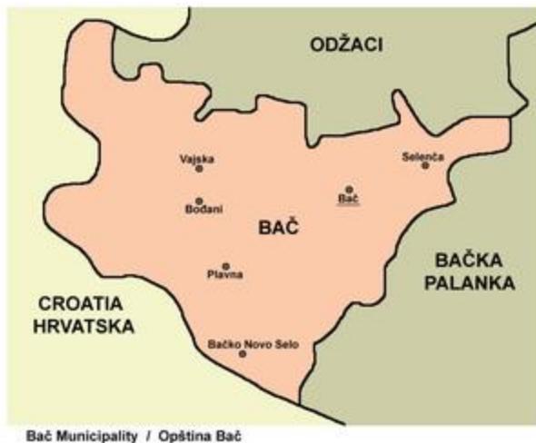
Слика 1. Мапа Општине 8